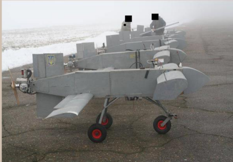
AQ 400 Scythe